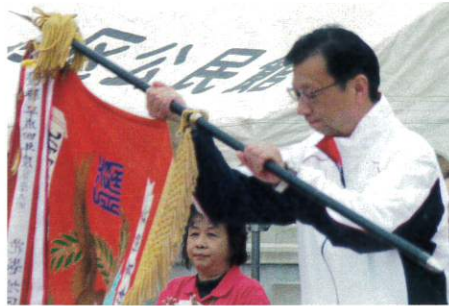
優勝旗返還を受ける上田市長