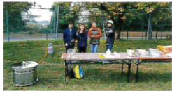
ハイゼックス炊き出し