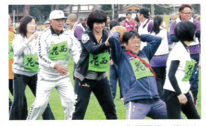
ボール送りレース石神町・北万丁目の皆さん