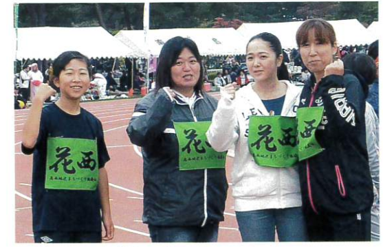
風船割りリレー西大通りの皆さん

藤沢町 「勝負の15秒間!!」今年の作戦は15秒目の最後の1投に全員が集中して投げるということで、選手20人が一生懸命取り組み頑張りました。みごと3位に躍進でき、みんな笑顔で終えることができました。