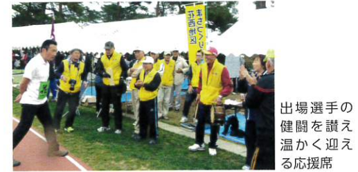
出場選手の健闘を讃え温かく迎える応援席