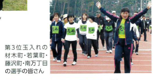
第3位玉入れの材木町・若葉町・藤沢町・南万丁目の選手の皆さん