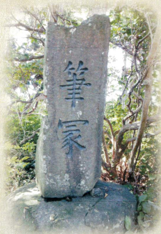
参考：和田甚五兵衛筆塚（天神境内）