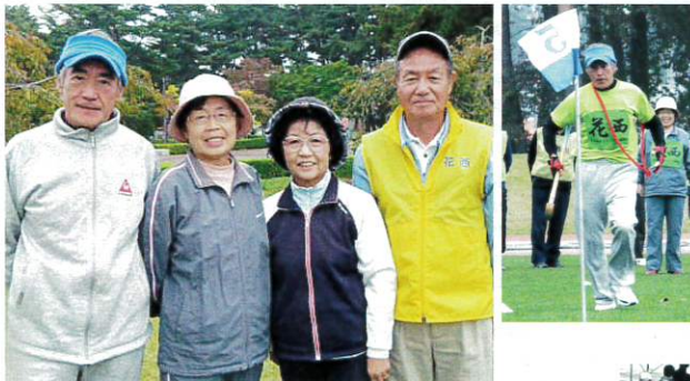
グラウンドゴルフリレーに出場した若葉町の皆さん