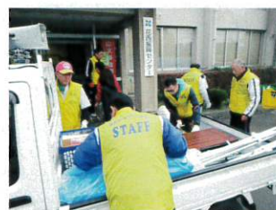
朝6時から物品搬入の準備をする花西地区スポーツ振興部役員