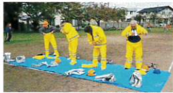
消防団はまだカー