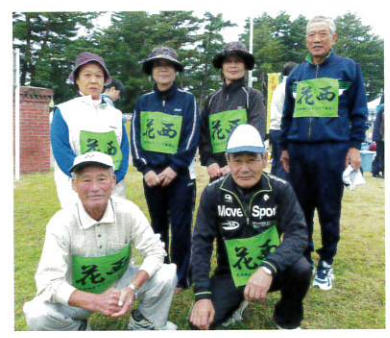
水満タンリレー南万丁目の皆さん