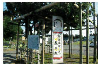
賢治ゆかりの梨の木