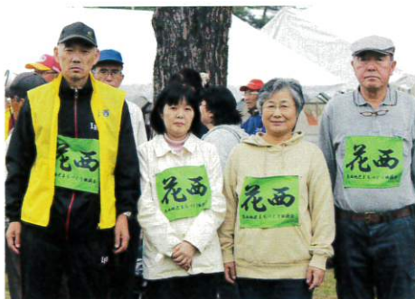
玉入れに出場した材木町の皆さん