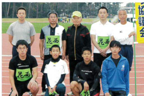
男子総員リレーのメンバー