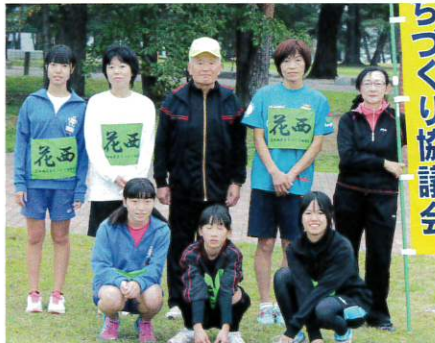
女子総員リレーのメンバー