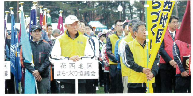
開会式に臨む花西選手団