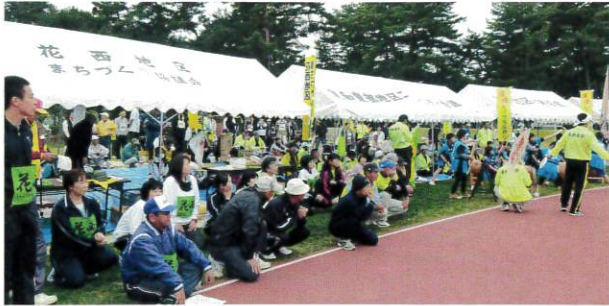
花西まちづくりの陣地 (左側)