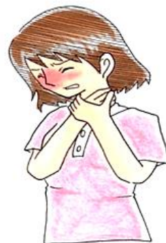
窒息のサイン (チョークサイン)