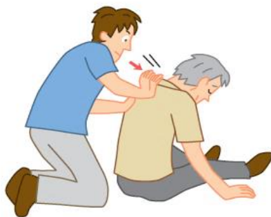
成人・小児の場合