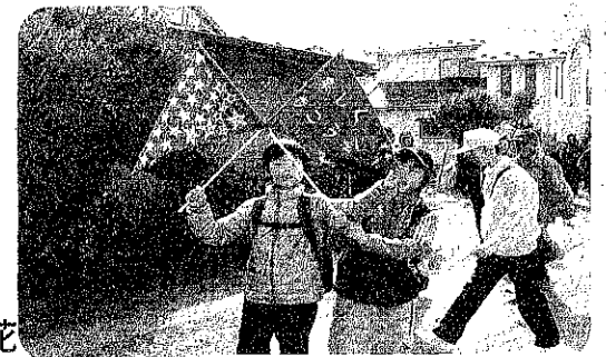
↑平成24年10月開催の様子