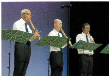
尺八二重奏 西大通り

発表会が住民相互の交流と親睦を深める役割を果たせたことと、皆様のご協力に感謝申し上げます。