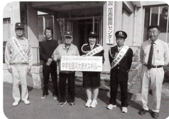
「一日警察署長」が花西振興センターを訪問しました (9月24日)