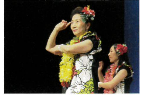
フラダンス 石神町