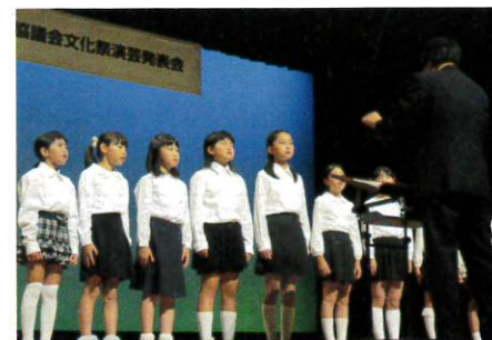
ぎんどろ児童合唱団